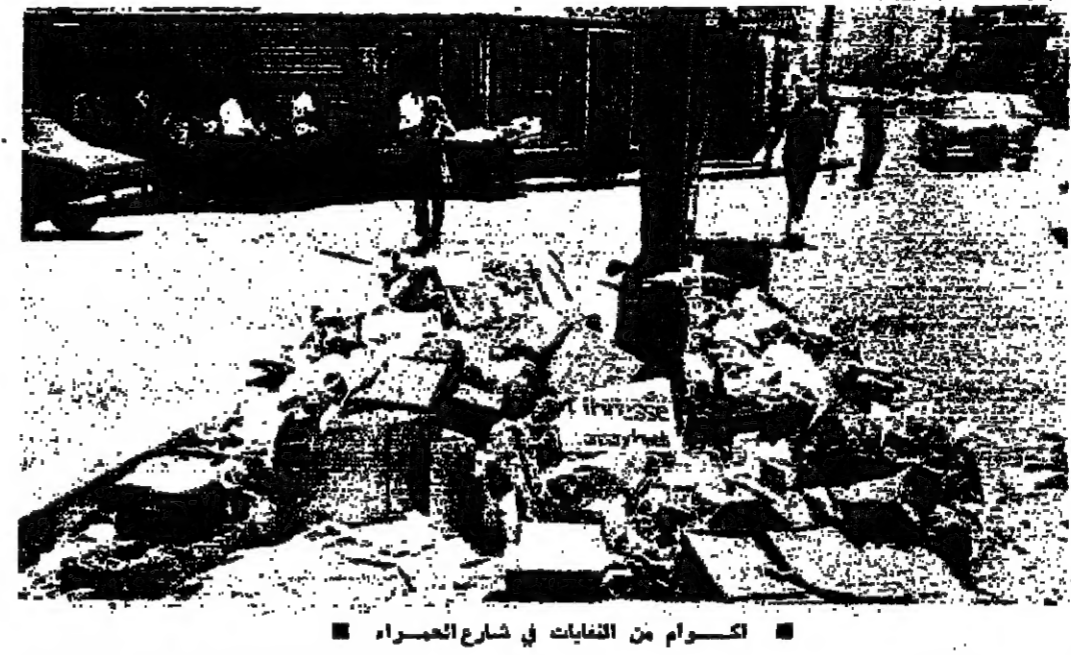
كسور من التفتيات في شارع الحراير

الزحام وعلى صعيد مرافق بيروت، وبلغ الزحام لونه، وقد جموع البواخر الموجودة في الاحواض وخارجها بحوالي ١٤٠ سفينة تنتظر دورها للتفريغ. وقد غارت بعض البواخر الرما في طريقها الى اللاذقية لتفريغ قسم من حمولتها، على ان تعود الى بيروت بعد هدوء الأوضاع. ودعا مدير شركة الرنسا السيد تليل طويبة شمال وموظفي شركة الرما التي استأنف أعمالهم كالمعاد اعتباراً من صباح اليوم، بغيه تفريغ السفن المنتظرة وتنشيط الرما.